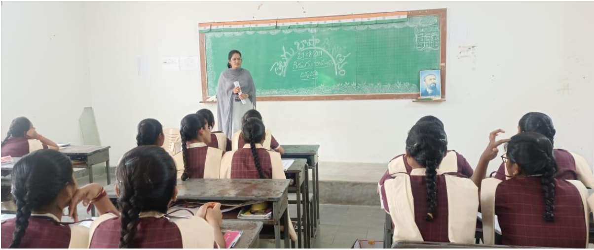
TELUGU BHASHA DINOSTHAVAM